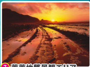
7 菜菜地質景觀エリア