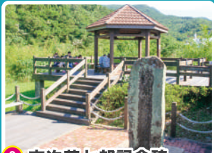
3 吉次茂七郎記念碑