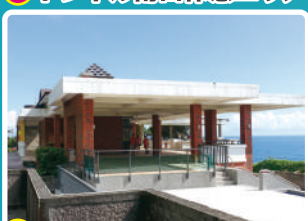
6 石城サービスエリア