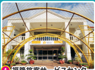
1 福隆旅客サービスセンター

注意： 旧草嶺トンネルへのハイキングは平日しか開放になっていません。休日はサイクリングの人数が多いので、万が一に備えるために、トンネルでは休日の歩行進入はご遠慮ください。トンネル内ではよくしっとり濡れているので滑りやすいから、どうか低速で進むようお願いします。