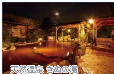
天然温泉 きぬの湯