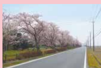
三坂新田・沖新田の桜