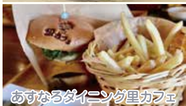
あすなろダイニング里カフェ