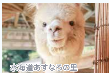
水海道あすなろの里